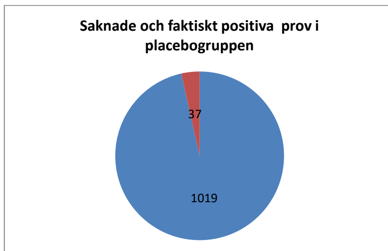
Diagram 2. Andel saknade prov i placebogrupper 1019; faktiskt positiva prov 37; De saknade proven utgör således 96 % av alla "positiva prov".