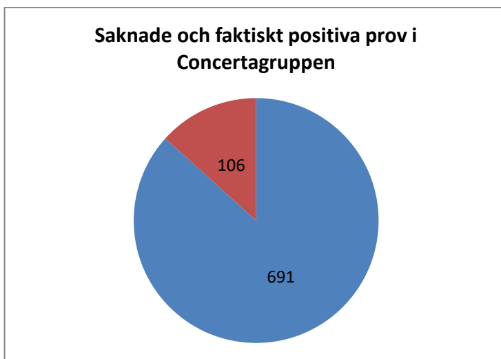
Diagram 3. Andel saknade prov i Concertagruppen 691; faktiskt positiva prov 106. De saknade proven utgör således 87 % av alla "positiva prov" (till skillnad från 96 % i placebogruppern.)